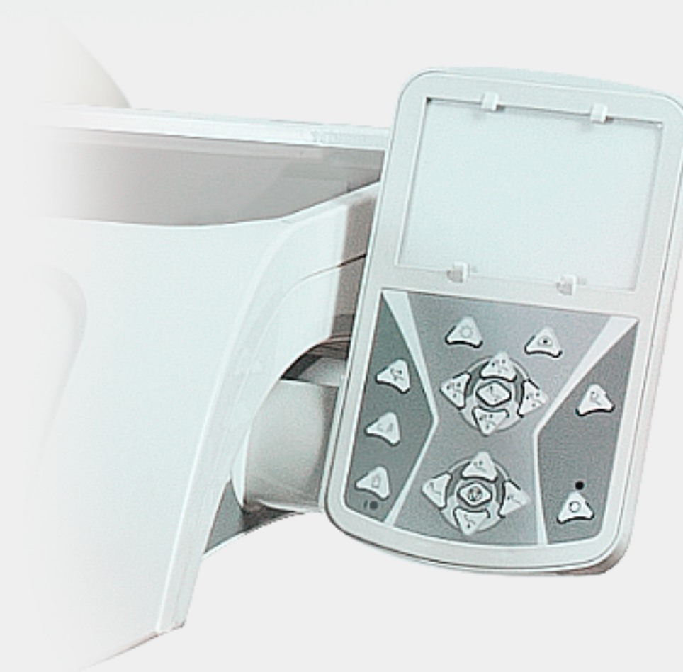
Control PAD con negatoscopio