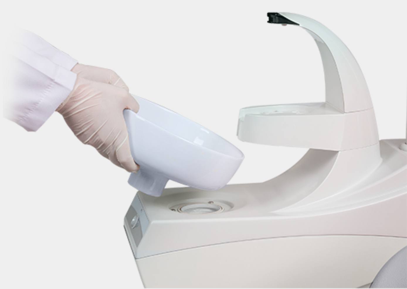
Unidad de agua con sensor de proximidad y escupidera extraíble de porcelana