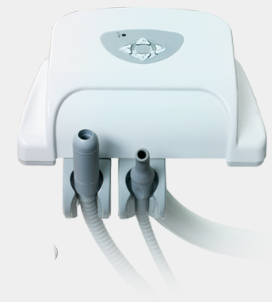
Brazo asistente con control PAD